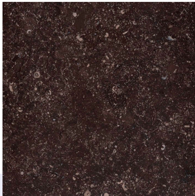
Foto is enkel indicatief, kleur- en structuurafwijkingen zijn mogelijk.

Dils D&W Natuursteen bvba Industriepark 8A 2235 Hulshout