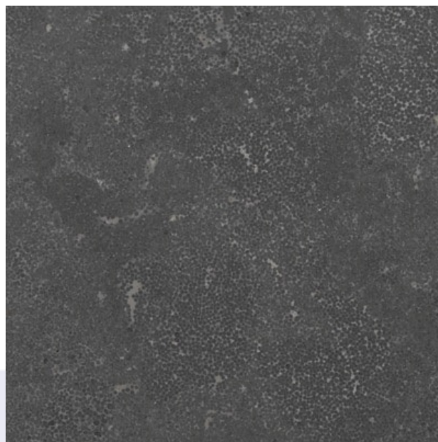
Foto is enkel indicatief, kleur- en structuurafwijkingen zijn mogelijk.

Dils D&W Natuursteen bvba Industriepark 8A 2235 Hulshout