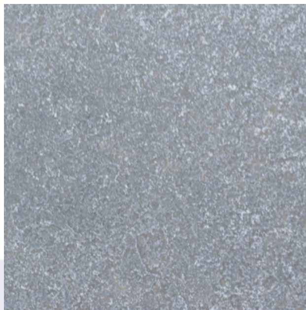
Foto is enkel indicatief, kleur- en structuurafwijkingen zijn mogelijk.

Dils D&W Natuursteen bvba Industriepark 8A 2235 Hulshout