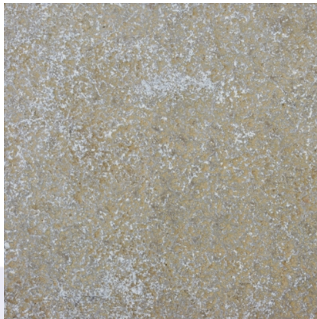
Foto is enkel indicatief, kleur- en structuurafwijkingen zijn mogelijk.

Dils D&W Natuursteen bvba Industriepark 8A 2235 Hulshout